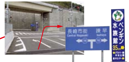
長崎芒塚IC出口付近(上の写真) 長崎IC方面からは長崎芒塚ICで降りられません。